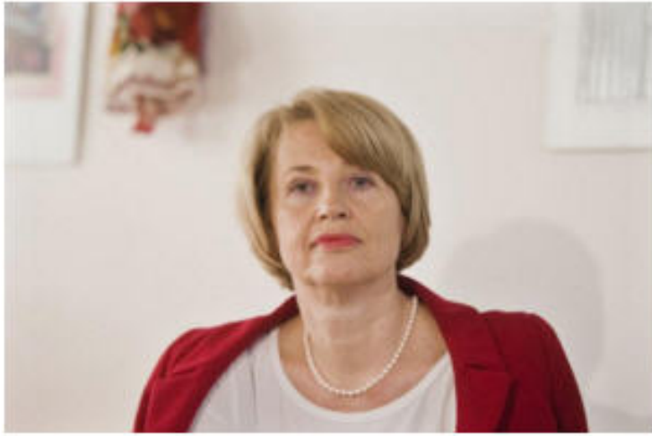
Število prijavljenih primerov novih diagnoz okužbe s HIV je v letu 2016 izrazito naraslo, opozarja Irena Klavs.

Zaradi učinkovitega zdravljenja izpostavljena oseba pozabi na temeljno preventivo. Posamezniki so izpostavljeni okužbi tudi zaradi vse bolj preprostih načinov spoznavanja partnerjev s pomočjo aplikacij na mobilnih telefonih, skupinskega počitniškega druženja bolj ali manj anonimnih oseb, ki se dogovorijo prek spleta, in vse pogostejše uporabe rekreacijskih oziroma družabnih drog, ki uživalcu vlijejo pogum in povečajo željo po spolnih odnosih, pojasnjuje infektolog.