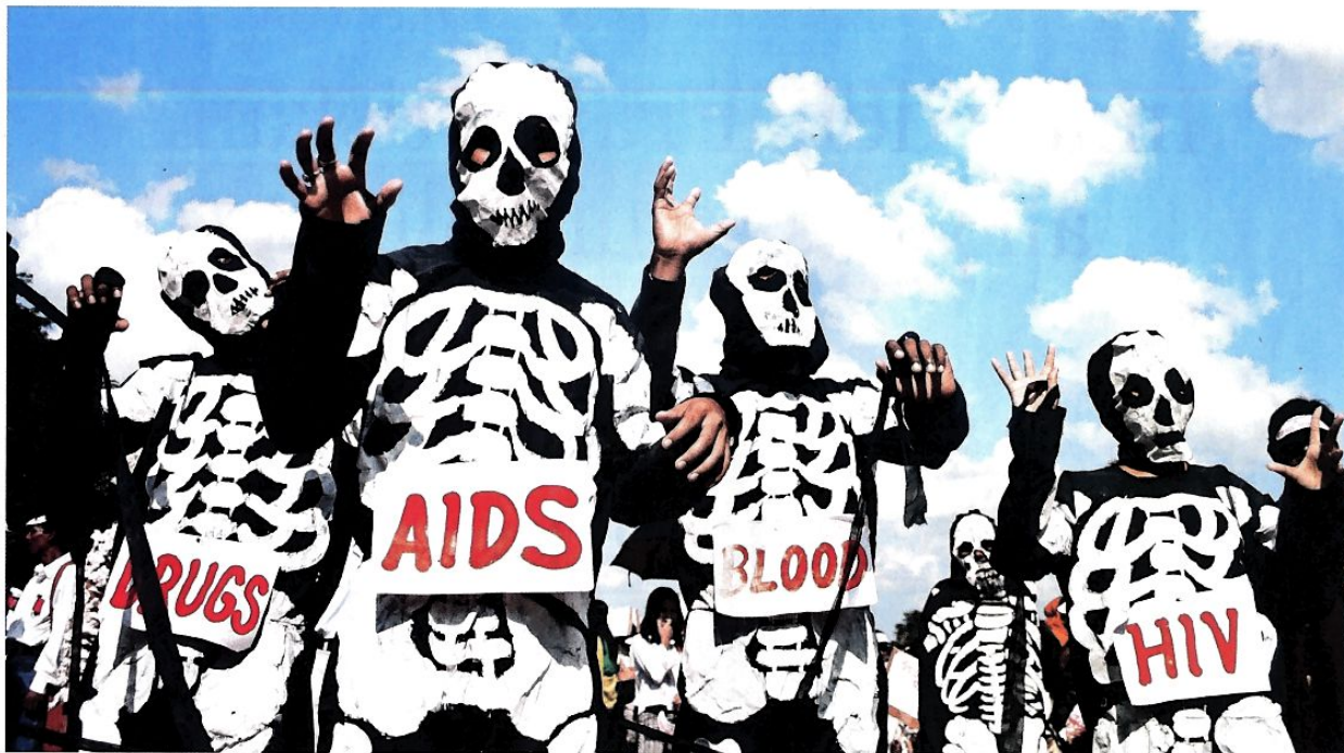
Prenos z okuženimi iglami se je zaradi preventivnih programov skoraj povsem ustavil, večina let mine brez enega samega primera.

»Škucova generacija aktivistov je zaslužna za razmeroma malo primerov okužbe z virusom HIV pri nas.«